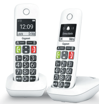
Téléphone à grosses touches