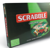
Jeux de société